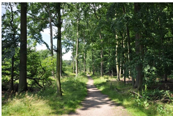
Der Höpen – vernachlässigtes Naherholungsgebiet

Der Wegezustand ist allerdings unzureichend, gleichzeitig sind wertvolle Bereiche für den Naturschutz (Pfarrteiche) in einem schlechten Zustand. Wir wollen, dass die wertvollen Bereiche des Höpens besser geschützt werden und gleichzeitig die Naherholungsmöglichkeiten verbessert werden.